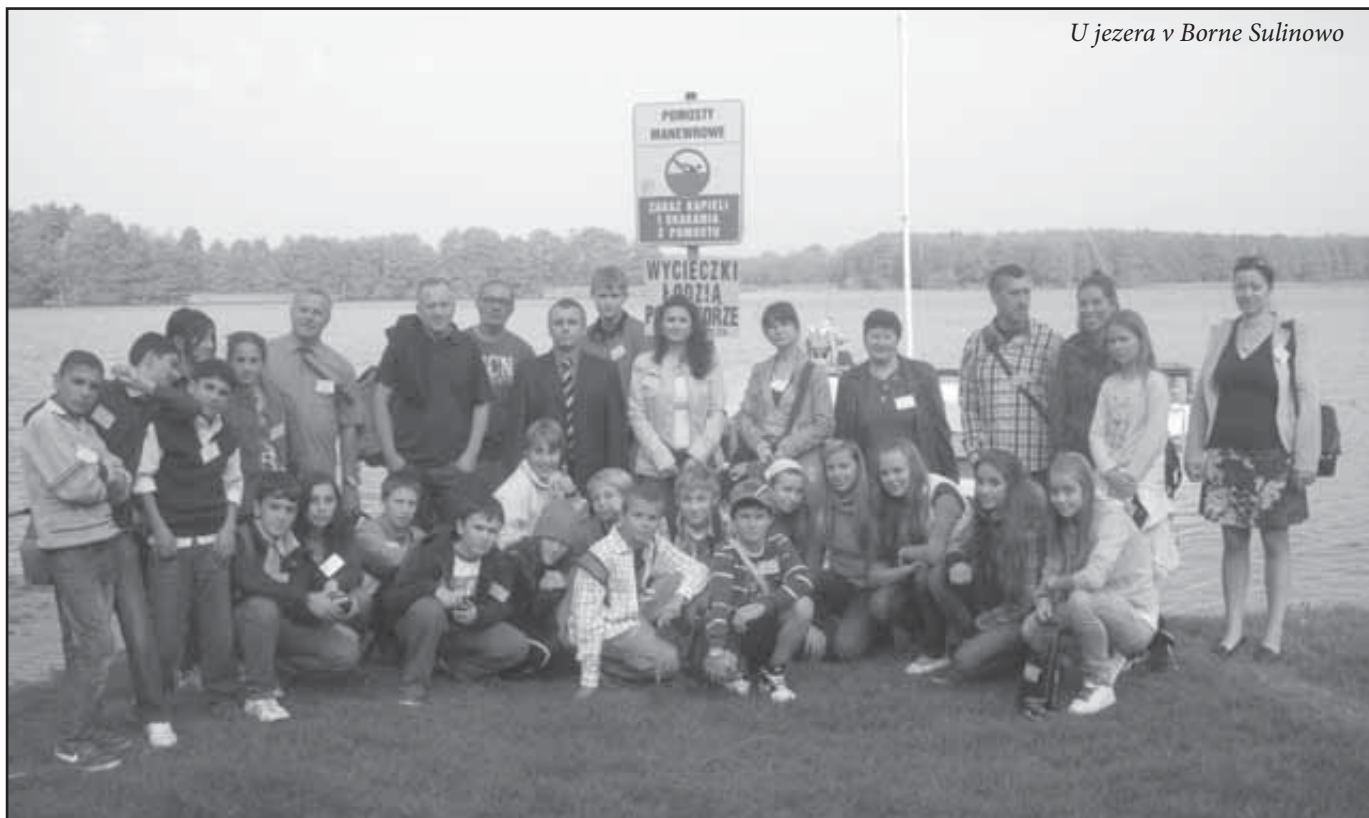
U jezera v Borne Sulinowo