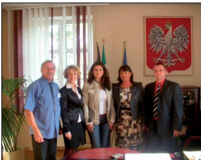
Přijetí u starostky města Borne Sulinowo