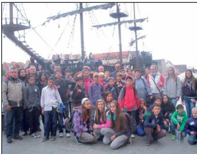
Přístav v Gdaňsku