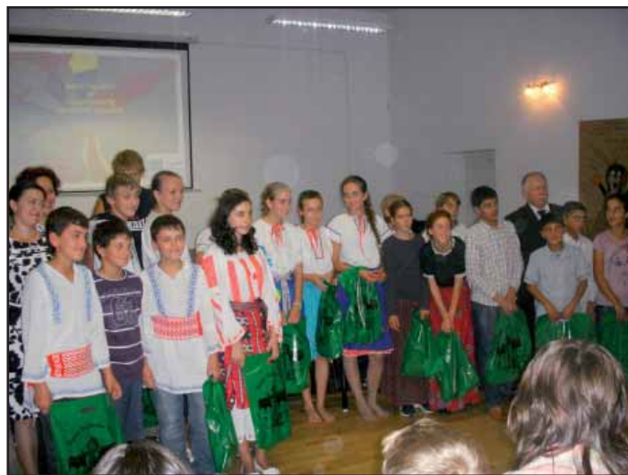
Závěrečný kulturní večer s přáteli z ostatních zemí.