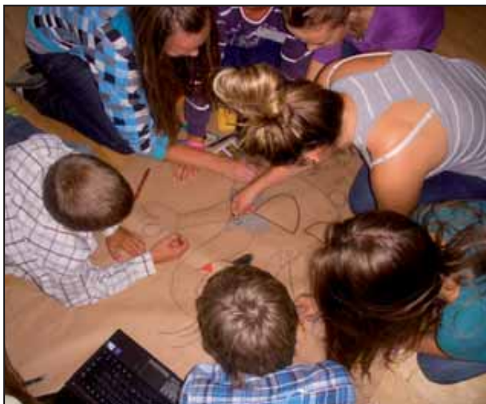
Workshop č.1 ve škole – Téma: Pohádková postava nejvíce charakterizující naši zemi