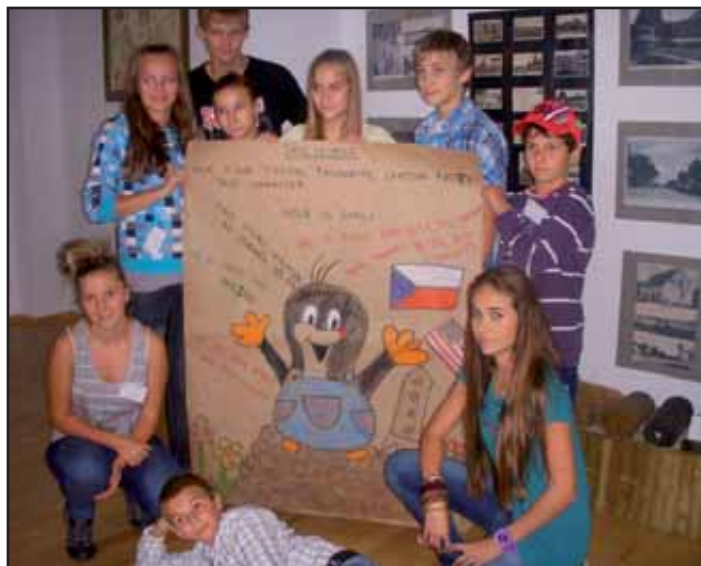
Výstup české skupiny – společná práce žáků (kresba Krtčka s popisem postavy v AJ)