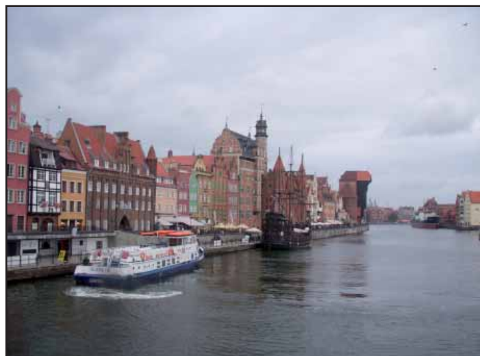
Výlet do Gdaňska – historická část města