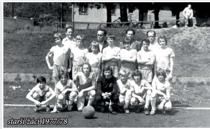
starší žáci 1977/78