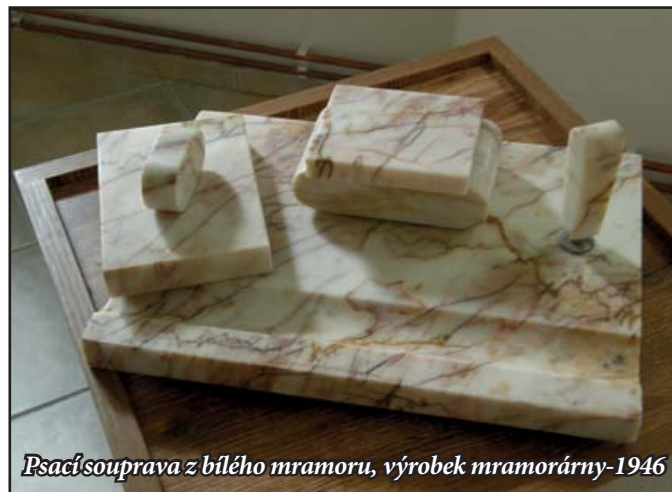
Psací souprava z bílého mramoru, výrobek mramorárny-1946

ný a rovněž sloužil jako firemní reklama. V Partyzánském na Slovensku je dodnes kostelík, jehož celá vnitřní výzdoba i obklad oltáře z mramorových desek byla vyrobena v rohatecké mramorárně v Soboňkách. Zpracovávala se domácí žula, syenit, mramor, travertin, aragonit, pískovec, onyx. Ze zahraničí pak to byl mramor italský, francouzský, belgický a finský. Výroba byla velmi žádaná, obklady byly trvanlivé a dobře se udržovaly. Po znárodnění v roce 1950 byl ale závod přestěhován do Přerova a budovy převzala JANKA n. p. Radotín k výrobě vzduchotechniky.