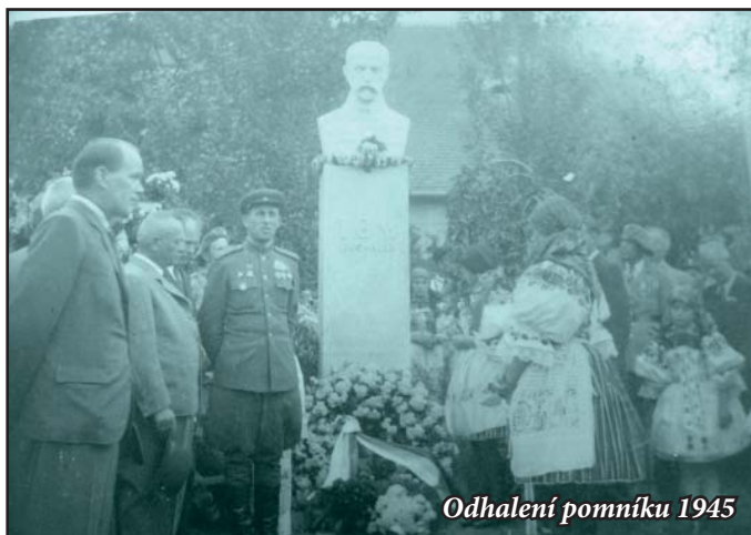
Odhalení pomníku 1945