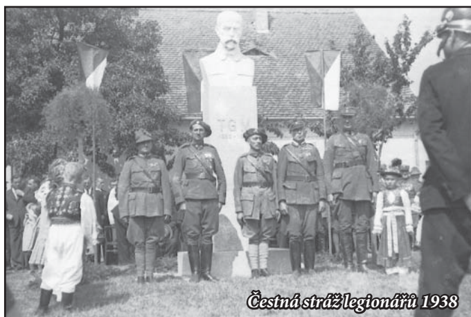
Čestná stráž legionářů 1938