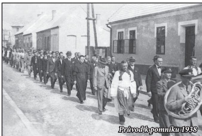
Průvod k pomníku 1938